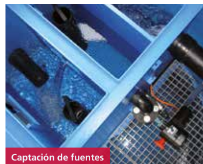
Captación de fuentes

El sistema de revestimiento HYDRO CLICK ha sido desarrollado en colaboración con la empresa suiza ETERTUB AG, que tiene más de 30 años de experiencia en el sector de captación de fuentes y almacenamiento de agua potable. El sistema HYDRO CLICK se caracteriza por su diseño, que garantiza un montaje rápido y seguro tanto en las instalaciones nuevas como en las de rehabilitación. El sistema está compuesto por una placa con elementos de fijación y de separación, que se moldean en el proceso de extrusión y calandrado, y por el perfil Click de fijación rápida. Nuestro material principal es el polietileno, que satisface los requisitos más exigentes de higiene alimentaria, resistencia mecánica y durabilidad.