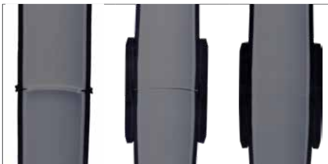
Soldadura a tope

Además de la segura estructura de 3 capas, MINELINE II puede unirse mediante una combinación de soldadura a tope y por electrofusión. Así se evita la existencia de posibles puntos débiles, y se protege el tubo frente a la abrasión.